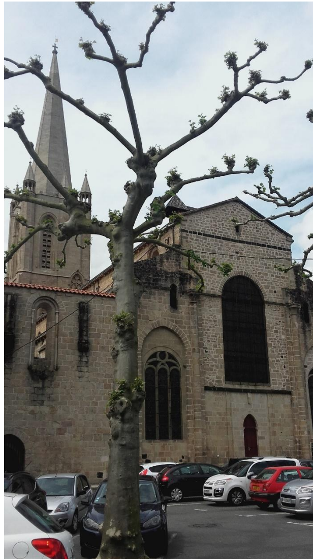
Fig . 2 : Chevet plat de la cathédrale de Tulle depuis l'effondrement en 1796 des chevet et transept médiévaux.

cathédrale, donnant au diocèse une église digne d'être celle du nouveau siège épiscopal et elle abrite toujours la cathèdre de l'évêque de Tulle. En revanche, après Arnaud de Saint-Astier et Arnaud de Clermont, peu d'évêques du XIV e siècle furent vraiment résidents 41 et les fidèles du diocèse de Tulle ne rencontrèrent pas plus leur évêque qu'ils ne devaient rencontrer celui de Limoges avant 1317.