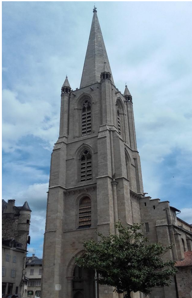
Fig . 3 : Flèche de granit de la cathédrale de Tulle.